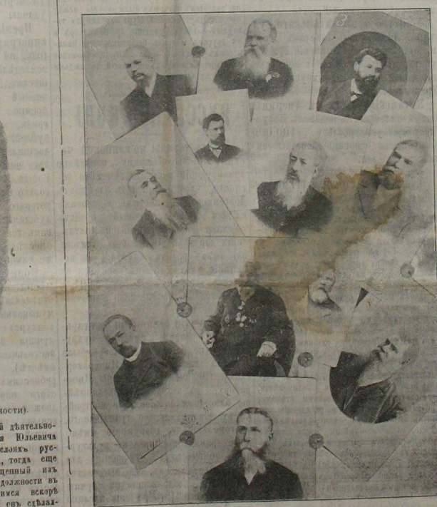
Советъ и правленіе оребургскаго общества взаимнаго кредита.

1-го Юня исполнилось 30 лѣтъ государственной и общественной дѣятельности министра финансовъ, статс-секретаря, тайнаго совѣтника Сергія Юльевича Витте, пользовавшагося широчайшей популярностью не только во всѣхъ слояхъ русскаго общества, но и заграничій. Тридцать лѣтъ тому назадъ С. Ю., тогда еще молодой кандидатъ физико-математическихъ наукъ, только что выходящій изъ Имперскаго университета, — началъ свою службу съ очень скромной должности въ Министерствѣ Южнорусскихъ желѣзныхъ дорогъ. Благодаря обнаружившимся вскорѣ административнымъ способностямъ и инициаторскому таланту, онъ съдѣлалъ замѣчательныя служебныя шаги адмирала Н. М. Чихачева, бывшаго въ то время директоромъ русскаго общества пароходства и торговли, а затѣмъ назначенъ на должность начальника движенія одесской жел. дороги въ тотъ моментъ, когда съ этой линіей была связана громадная ответственность, въ виду передельной войны между нами по случаю р. сев.-турецкой войны 1877—78 гг.